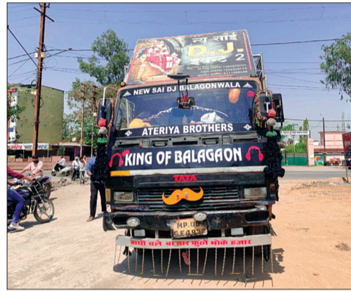
हरिभूमि न्यूज | सीहोर

व्यापारियों का आरोप है कि डीजे की आवाज इतनी तेज थी कि उसके कंपन से महिला की तबीयत अचानक बिगड़ गई। उन्हें संभालने का प्रयास किया गया, लेकिन करीब 10 मिनट के भीतर ही उन्होंने दम तोड़ दिया।